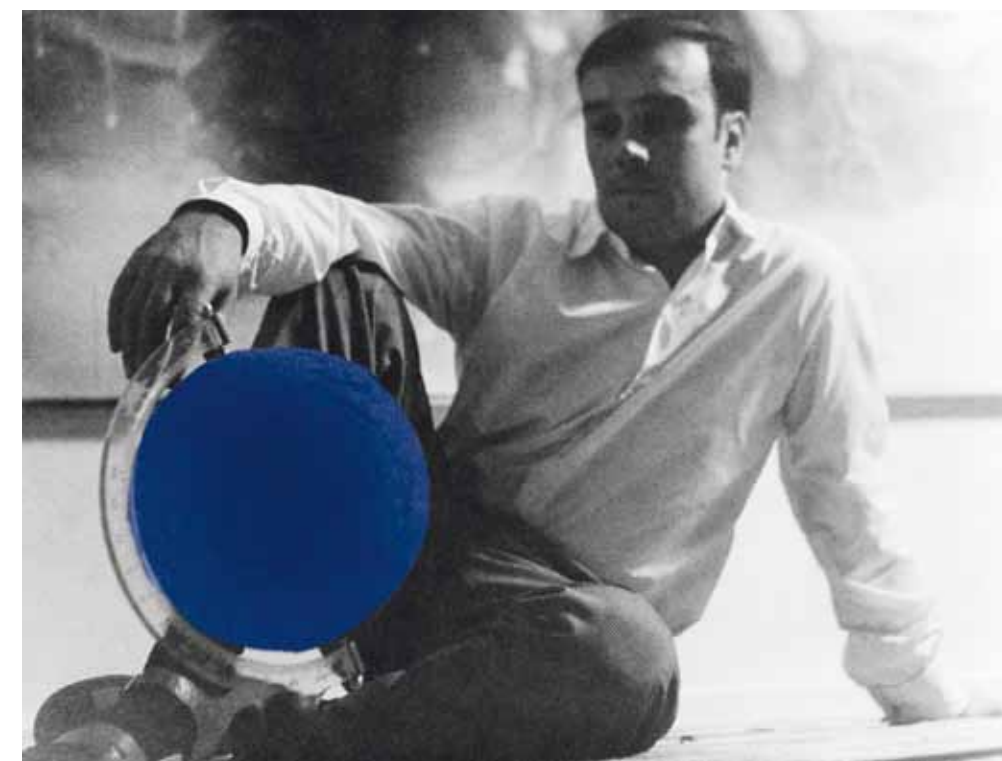
Yves Klein et le Globe Terrestre Bleu , (RP 5), dans son atelier 14, rue Campagne-Première, Paris Yves Klein and le Globe Terrestre Bleu , (RP5), in his studio, 14, rue Campagne-Première, Paris © Yves Klein, ADAGP, Paris, 2015