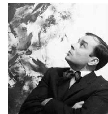
Yves Klein devant une Anthropométrie , Galerie Rive Droite, Paris, 1960 Yves Klein in front of an Anthropometry , Galerie Rive Droite, Paris, 1960 © Yves Klein, ADAGP, Paris, 2015