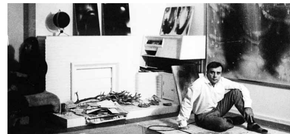
Yves Klein dans son atelier, 14, rue Campagne-Première, Paris / Yves Klein in his studio, 14, rue Campagne-Première, Paris © Yves Klein, ADAGP, Paris, 2015