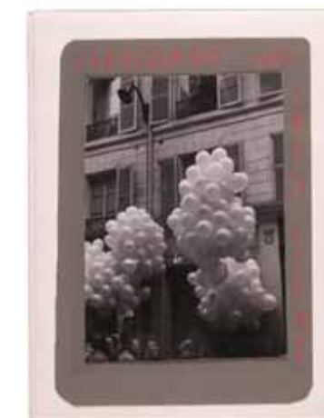
Page d'un pressbook d'Yves Klein, Sculpture Aérostatique devant la galerie Iris Clert lors du vernissage de l'exposition "Propositions Monochromes", Paris, 10 mai 1957 Yves Klein's pressbook page, Aerostatic sculpture in front of Iris Clert gallery for the private viewing of the "Propositions Monochromes" exhibition, Paris, 10 May 1957 © Yves Klein, ADAGP, Paris, 2015

Yves Klein married Rotraut Uecker, a young German artist, on 21 January 1962. He died a few months later at the age of 34, leaving an oeuvre that is intense, bold and embodies notions of the infinite, an oeuvre that continues to inspire new generations of artists and those passionate about our times.