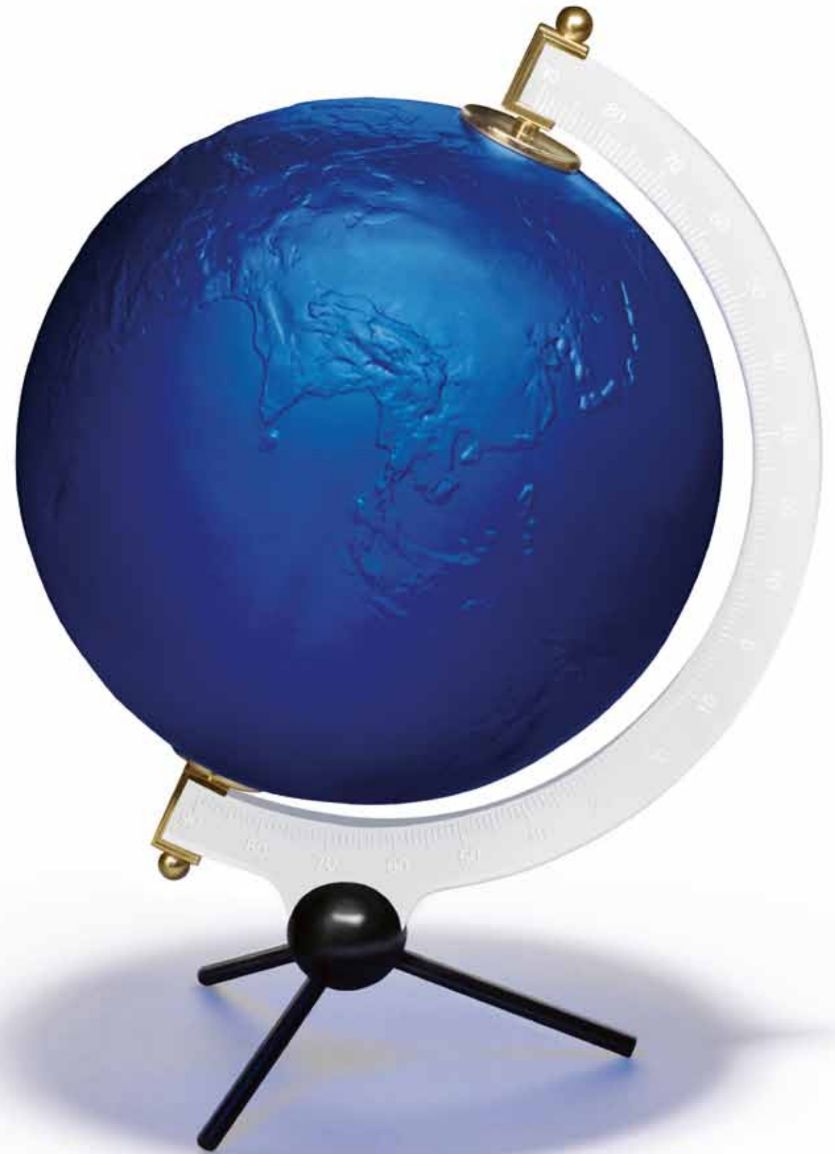
La Terre Bleue, Yves Klein™ by Lalique, 2015 Cristal / Crystal, 39 x 28,5 x 25 cm 100 + 20 HC

Originally created by Yves Klein in 1961, the "Terre Bleue" takes on a completely new dimension in crystal, giving it an unrivalled transparency, the light revealing the essence of the material.